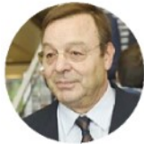
MARCO BONOMETTI Presidente di Confindustria Lombardia